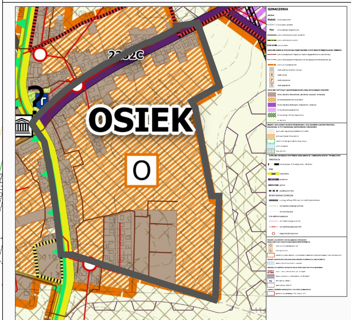
RYSU ZE STUDIUM UWARUNKOWAŃ I KIERUNKÓW ZAGOSPODAROWANIA PRZESTRZENNEGO GMINY OSIEK