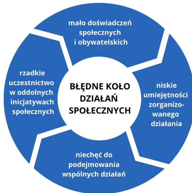
Diagram 1: Błędne koło działań dla społeczności