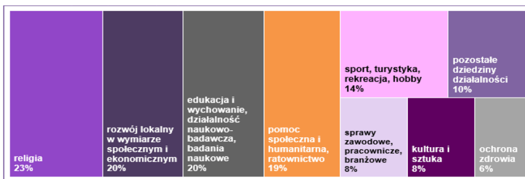
Wykres 11. Struktura wolumenu wolontariatu w organizacjach w 2015 r. według dziedziny działalności organizacji lub instytucji.