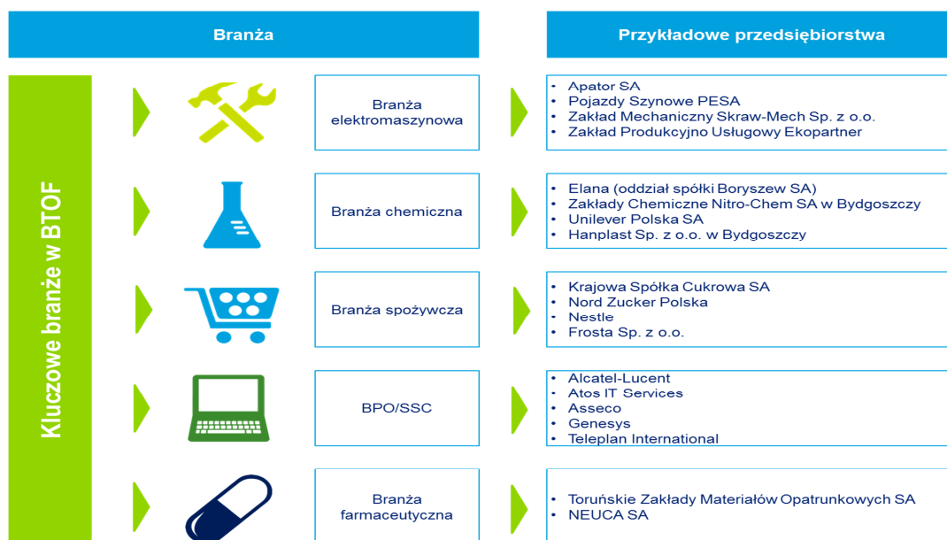
Schemat 3 Kluczowe branże BTOF

Na poniższym schemacie zaprezentowane zostały branże kluczowe dla lokalnej gospodarki wraz ze wskazaniem najważniejszych przedsiębiorstw działających w tych sektorach.