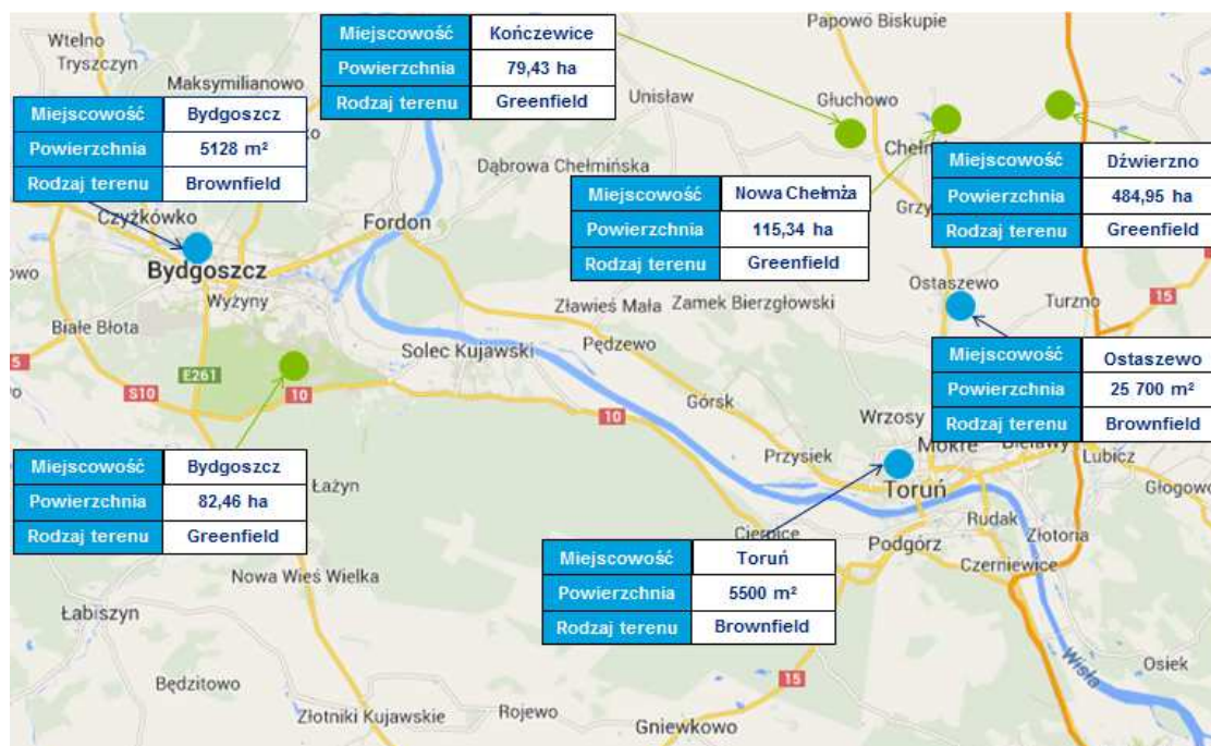
Rysunek 3 Rozmieszczenie największych terenów inwestycyjnych w Bydgosko-Toruńskim Obszarze Funkcjonalnym w 2014 r.