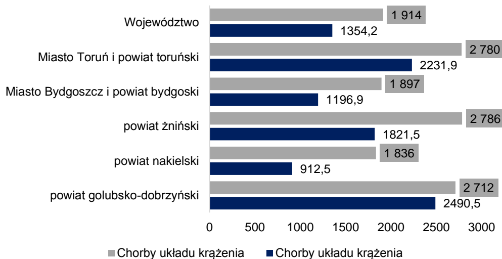
Wykres 22 Dorośli, u których stwierdzono choroby układu krążenia, według powiatów w latach 2008-2012 (wskaźnik na 10 tys. ludności)

Źródło: Opracowanie własne na podstawie materiałów KP UW (Wydział Zdrowia)