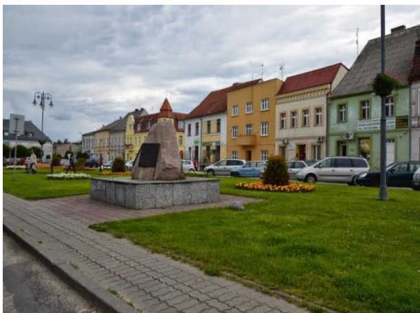
Fot. 7. Miasto Łabiszyn

Łabiszyn, siedziba gminy miejsko-wiejskiej, położony jest w południowo-zachodniej części województwa kujawsko-pomorskiego, około 25 km od Bydgoszczy, na granicy Pałuk i Kujaw. Liczy 4,5 tys. mieszkańców. Położenie gwarantuje mu dużą różnorodność rzeźby terenu, gatunków gleb oraz szaty roślinnej. Przez miasto przepływa rzeka Noteć, która poprzez Kanał Bydgoski łączy się z Brdą, tworząc ciekawą turystycznie trasę spływu. Współcześnie miasto odgrywa rolę lokalnego centrum produkcyjnego z przemysłem chemicznym, spożywczym, elektronicznym i meblowym.