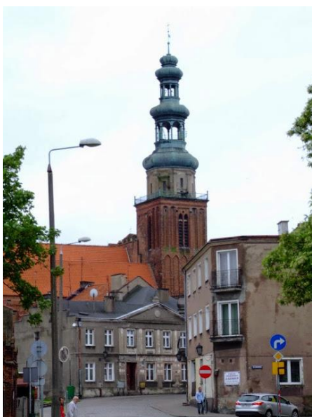
Fot. 9. Miasto Chelmża

Miasto w powiecie toruńskim liczące ok. 15 tys. mieszkańców. Jedno z najstarszych miast ziemi chełmińskiej, oddalone o 20 km od Torunia. Położenie, układ urbanistyczny, zabytki i jezioro stanowią główne walory miejscowości.