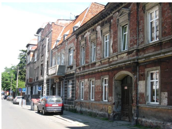
Fot. 59. Ulica T. Kościuszki