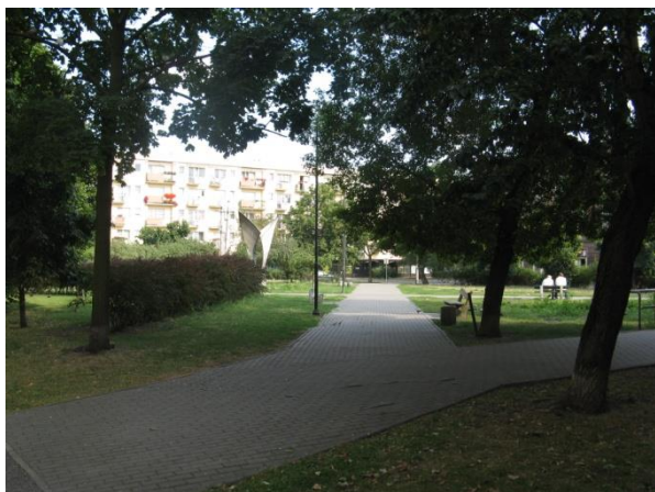
Fot. 61. Plac Tadeusza Kościuszki

Sposób zagospodarowania terenu ze zwartą zabudową mieszkaniowo-usługową w zachodniej części obszaru skutkuje bardzo niewielkim udziałem zieleni urządzonej. Dostępne tereny rekreacji w granicach tej części jednostki to głównie niewielki Plac Kościuszki. Znacznie lepiej pod tym względem wypada część wschodnia gdzie zlokalizowany jest Ogród Botaniczny UKW i bliskość parków śródmiejskich (m. in. Jana Kochanowskiego).