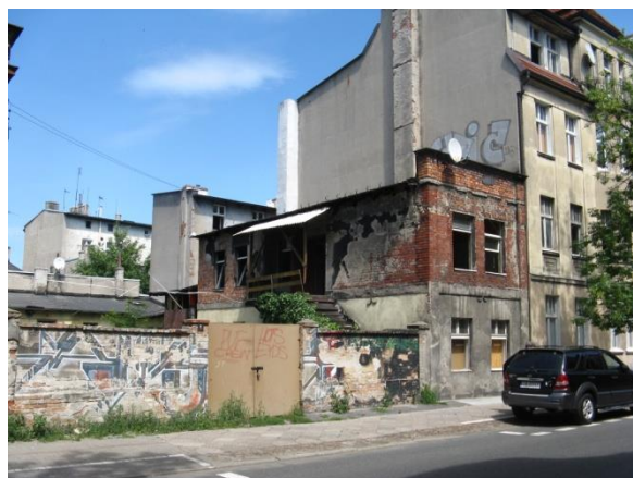
Fot. 60. Ulica Mazowiecka

W zakresie terenów rekreacyjno-wypoczynkowych na Bocianowie występuje ich znaczny deficyt. Mieszkańcy tej jednostki mają do dyspozycji 2 boiska sportowe typu „Orlik”, a na każdy z nich przypada statystycznie 5 223 osób powyżej 12 roku życia. Taki stan zainwestowania świadczy o dużym przeciążeniu i wymagane jest doinwestowanie w tym zakresie. Wskazana jest także budowa nowych placów zabaw 87 .