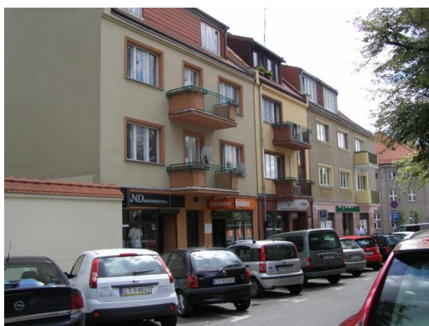
Fot. 121. Odnowione kamienice przy ul. Fosa Staromiejska

Rewitalizacja zarówno obiektów publicznych, jak i zasobów mieszkaniowych przyczyniła się nie tylko do poprawy ich funkcjonalności i standardu, ale przy okazji spowodowała, że najbardziej reprezentacyjna część miasta naprawdę wypiękniała. Spacerując obecnie ulicami Starego Miasta, zarówno tymi, które stanowią główne ciągi komunikacyjne (ul. Szeroka, Żeglarska, Kopernika, Mostowa, Królowej Jadwigi), jak i tymi mniej uczęszczanymi (ul. Piekary, Ślusarska, Rabiańska, Sukiennicza), na każdej z nich zauważyć można jedynie pojedyncze kamienice wymagające odrestaurowania. Najczęściej są to budynki, które mają niuregulowane sprawy własnościowe.