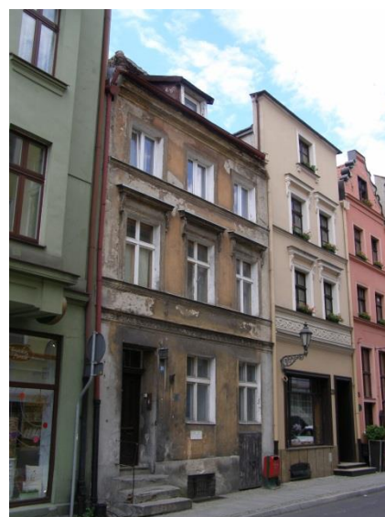
Fot. 122. Jedna z niewielu kamienic przy ul. Św. Ducha wymagająca remontu

Choć w ramach przeprowadzonych prac budowlano – konserwatorskich, odnowiono nie tylko kamienice, ale także ich otoczenie (m.in. miało to miejsce w przypadku kamienic przy ul. Wielkie Garbary 3 i 5 czy Królowej Jadwigi 20), to jednak nadal można zauważyć, że część podwórek wymaga