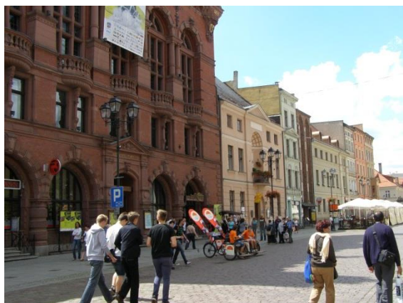
Fot. 119. Odnowiony Dwór Artusa i kamienice na Starym Rynku

Ponadto wykonano szereg projektów, które w znacznym stopniu poprawiły funkcjonalność toruńskiej starówki m. in. dokonano adaptacji zabytkowej Baszty Gołębnik na pracownię artystyczne i siedziby organizacji pozarządowych, wykonano kompleksowy remont Młodzieżowego Domu Kultury, przeprowadzono renowację Dworu Artusa, zagospodarowano ulice Szeroką i Królowej Jadwigi, dokonano adaptacji kamienic na cele muzealne – Muzeum Podróżników (kamienica przy ul. Franciszkańskiej 11) czy Muzeum „Świat Toruńskiego Piernika” (kamienica przy ul. Strumykowej 4).