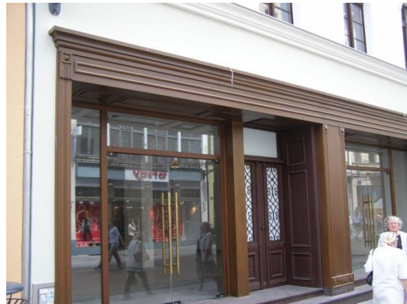
Fot. 126. Pusty lokal po sklepie C&A

Ponadto dużym utrudnieniem w dostępie do większości lokali użytkowych dzielnicy jest brak dostosowania ich do potrzeb osób niepełnosprawnych. Brak podjazdów czy personelu wykwalifikowanego do obsługi osób niepełnosprawnych, wyklucza te osoby z grupy potencjalnych klientów lokali użytkowych, podobnie jest w przypadku z małymi dziećmi, które po schodach nie wjadą wózkami do lokalu.