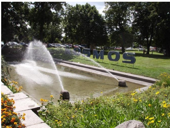
Fot. 127. Teren zieleni przy Placu Rapackiego

Trzeci problem stanowi wyludnianie się dzielnicy. Według stanu na 2006r., a więc w czasie gdy opracowywano poprzedni Lokalny Program Rewitalizacji, liczba mieszkańców Starego Miasta wynosiła 8840 mieszkańców. Zgodnie z przeprowadzoną w niniejszym dokumencie analizą społeczno-gospodarczą, liczba mieszkańców dzielnicy według stanu na koniec 2012 roku wynosiła 6707, a więc liczba lokalnej ludności na przełomie 6 lat spadła aż o ponad 2000 osób. Przyczyn takiego stanu rzeczy można upatrywać m. in. w starzeniu się (umieranie mieszkańców) i ubożeniu społeczeństwa. Stare Miasto jest także mało przyjazne dla mieszkańców pod względem dostępności terenów zieleni i infrastruktury rekreacyjnej. Dzielnica dysponuje terenami zieleni m.in. przy Placu Rapackiego, Alei Jana Pawła II, Przy Kaszowniku, na Bulwarze Filadelfijskim, przed budynkiem Muzeum Etnograficznego. Większość terenów zieleni występujących w obrębie Starego Miasta ma jednak charakter reprezentacyjny. Nie są wyposażone w place zabaw dla dzieci, czy np. siłownię zewnętrzną dla dorosłych. Dzieci starsze i młodzież mogą korzystać z infrastruktury sportowej w Fosie Staromiejskiej. Jedyne ogólnie dostępne place zabaw dla młodszych dzieci znajduje się przy ul. Podmurnej. Przedstawiona powyżej sytuacja nie zachęca do zamieszkania na Starym Mieście.