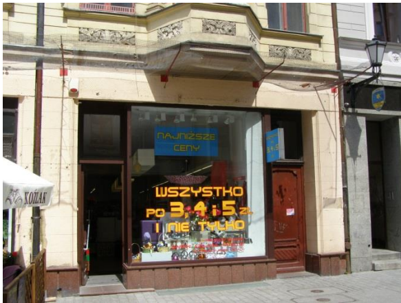
Fot. 125. Jeden ze sklepów przy ul. Szerokiej z nieestetycznym szyldem