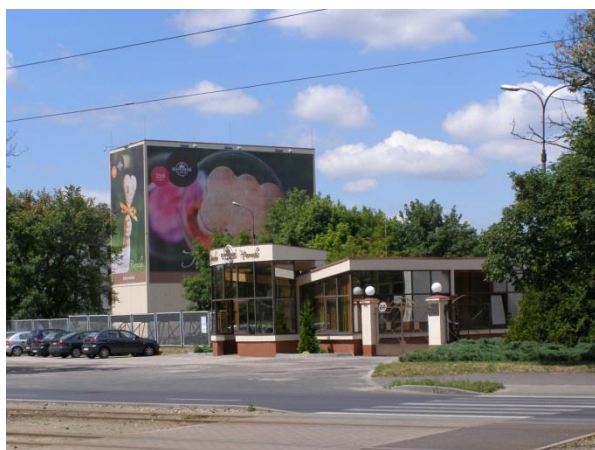
Fot. 143. Fabryka Cukiernicza KOPERNIK S.A.