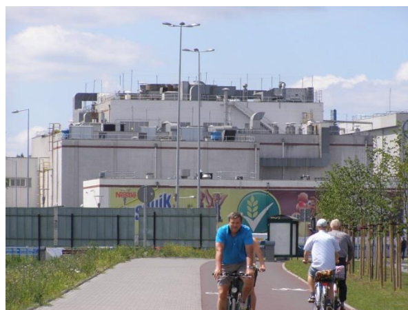
Fot. 144. Toruń-Pacific Sp. z o.o.

Po II wojnie światowej następowała dalsza rozbudowa funkcji przemysłowych dzielnicy – powstały tu takie zakłady jak m.in. Apator, Metron, Toruńskie Zakłady Materiałów Opatrunkowych, dawna chłodnia.