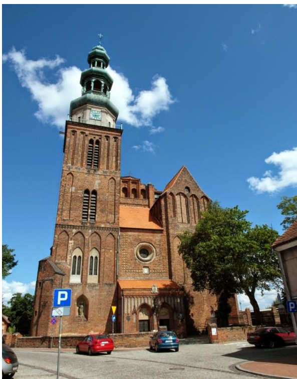
Fot. 176. Konkatedra pw. Świętej Trójcy