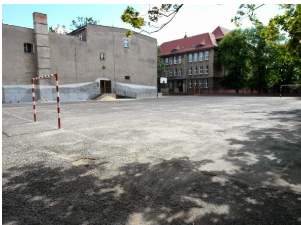
Fot. 174. Boisko przy zespole szkół znajdującymi się pomiędzy ulicami gen. Hallera, P. Skargi oraz I. Paderewskiego

w niedostatecznej jakości sieci wodno-kanalizacyjnej, energetycznej, gazowej (szczególnie przy ul. Św. Jana, ul. P. Skargi, a także w innych częściach centrum). W złym stanie technicznym są budynki szkół zlokalizowanych między ulicami Gen. J. Hallera, P. Skargi oraz I. Paderewskiego). Brakuje boisk szkolnych przy Gimnazjum nr 1, Szkole Podstawowej nr 2, Szkole Podstawowej nr 3, Szkole Podstawowej nr 5 oraz sali gimnastycznej przy Szkole Podstawowej nr 3. Gimnazjum nr 1, Szkoła Podstawowa nr 2 oraz Szkoła Podstawowa nr 5 posiadają nieprzystosowane, nie w pełni wyposażone i niepełnowymiarowe sale gimnastyczne. Również teren przylegający do szkół wymaga uporządkowania i lepszego zagospodarowania. W centrum miasta znajduje się niewielka powierzchnia terenów zieleni miejskiej.