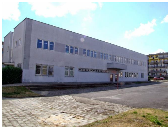
Fot. 175. Boisko przy Szkole Podstawowej nr 5