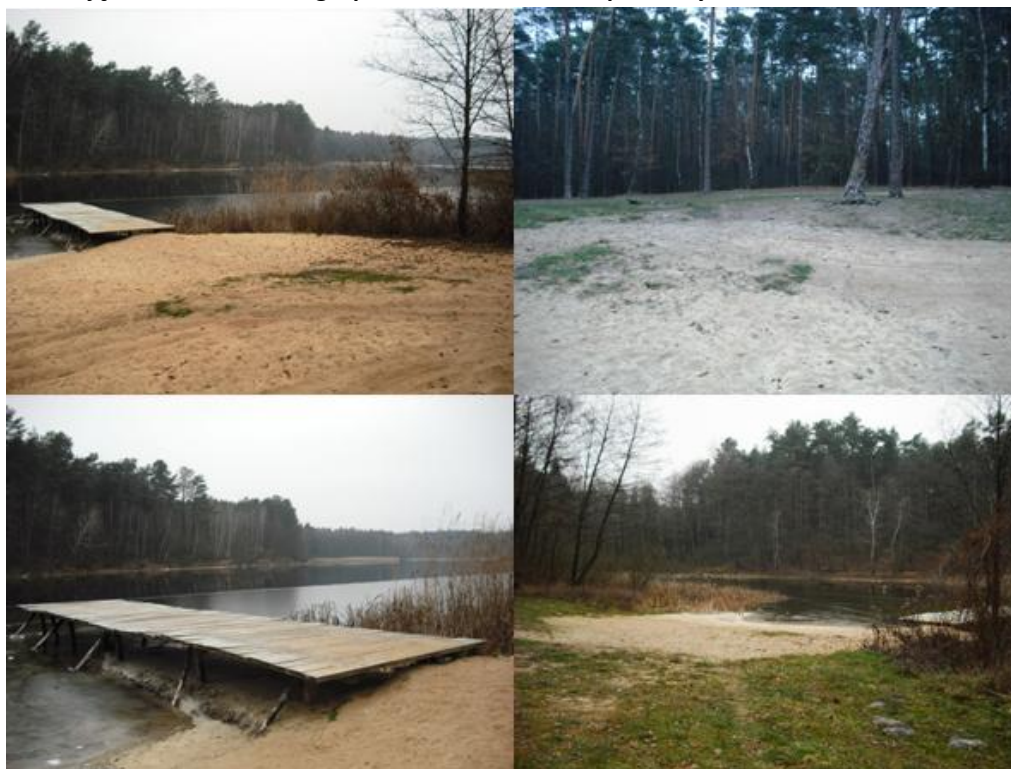
Zdjęcie 21. Aktualne zagospodarowanie terenów położonych nad Jeziorem Zacisze

W okresie letnim jezioro stanowi główne miejsce wypoczynku na terenie gminy, m. in. ze względu na swoje atrakcyjne położenie w otoczeniu lasów. Jezioro stanowi miejsce wykorzystywane do kąpieli przez mieszkańców gminy Czernikowo, jest wyposażone w pomost i niewielką plażę.