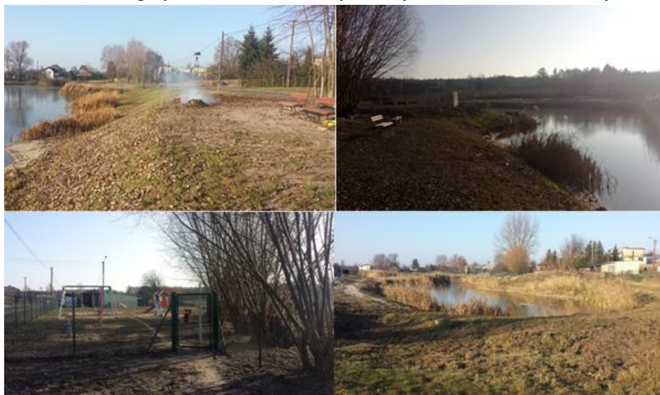
Zdjęcie 22. Aktualne zagospodarowanie terenów położonych nad zbiornikiem wodnym w Janowie

Zagospodarowanie terenu zlokalizowanego nad zbiornikiem jest dosyć ubogie i ogranicza się do nielicznych obiektów małej architektury (ławki) oraz ogrodzonego plac zabaw, zlokalizowanego w sąsiedztwie zbiornika. Niemniej, należy podkreślić, że zbiornik jest w dużej mierze oczyszczony, a teren wokół niego wraz z istniejącymi nasadzeniami jest uporządkowany. Teren ten jest również ogrodzony, co zapewnia bezpieczeństwo jego użytkownikom. Ograniczona dostępność infrastruktury nad zbiornikiem w Janowie osłabia jednak możliwości jego pełnego wykorzystania przez lokalnych mieszkańców w celach wypoczynkowo-rekreacyjnych.