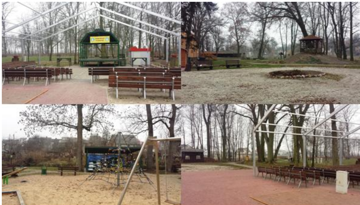
Zdjęcie 33. Aktualne zagospodarowanie terenów położonych na Wyspie Parkowej – część północna

Wyspa Parkowa jest podzielona rowem z wodą na dwie części – północną (działka o numerze ewidencyjnym 514) oraz południową (działka o numerze ewidencyjnym 513). Część północna wyspy została poddana rewitalizacji i na chwilę obecną jest zagospodarowana infrastrukturą o charakterze kulturalno-rekreacyjnym. W tej części jest zlokalizowany zmodernizowany budynek łabiszyńskiego Domu Kultury. Na wyspie znajduje się marina z możliwością bezpłatnego wypożyczenia kajaków i rowerów wodnych. Ponadto, zlokalizowane tam są: plac zabaw z siłownią zewnętrzną, zadaszony amfiteatr, obiekty małej architektury (ławki, kosze na śmieci, oświetlenie) oraz ciągi komunikacyjne.