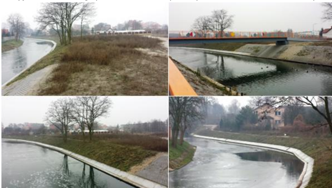
Zdjęcie 35. Aktualne zagospodarowanie terenów położonych nad Kanałem Noteckim w Łabiszynie

Na terenie gminy Łabiszyn jest zlokalizowana jedna śluza – śluza Łabiszyn. Obszar nadbrzeży Kanału Noteckiego na terenie gminy pozostaje na chwilę obecną niezagospodarowany. Szczególnie widoczne jest to w Łabiszynie, gdzie poza nieutwardzonymi ciągami komunikacyjnymi, nie występuje żadna infrastruktura o charakterze rekreacyjnym, która umożliwiłaby aktywizację tego obszaru oraz stworzenie z niego atrakcyjnej dla mieszkańców przestrzeni publicznej.