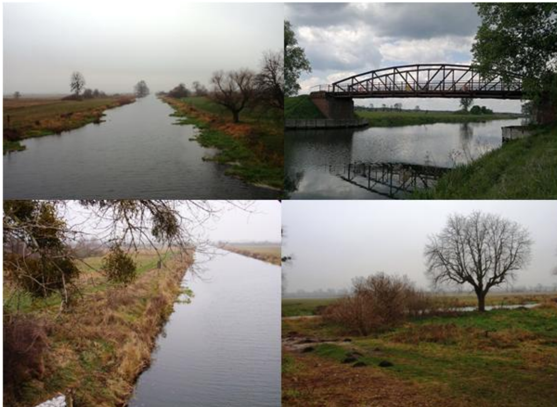
Zdjęcie 48. Aktualne zagospodarowanie terenów położonych nad Kanałem Bydgoskim w gminie Sicienko

Tereny zlokalizowane nad Kanałem Bydgoskim stanowią po części własność Gminy Sicienko, a po części własność prywatną. Kanał Bydgoski oraz tereny zlokalizowane w jego bezpośrednim sąsiedztwie nie są objęte miejscowym planem zagospodarowania przestrzennego. Obszar ten na chwilę obecną jest niezagospodarowany. Znajdują się tam jedynie nieutwardzone drogi wykorzystywane przez mieszkańców okolicznych miejscowości w celach rekreacyjnych. Ponadto, na wysokości miejscowości Kruszyniec, przy ujściu Kanału Górnonoteckiego, jest zlokalizowany most, służący lokalnej komunikacji.