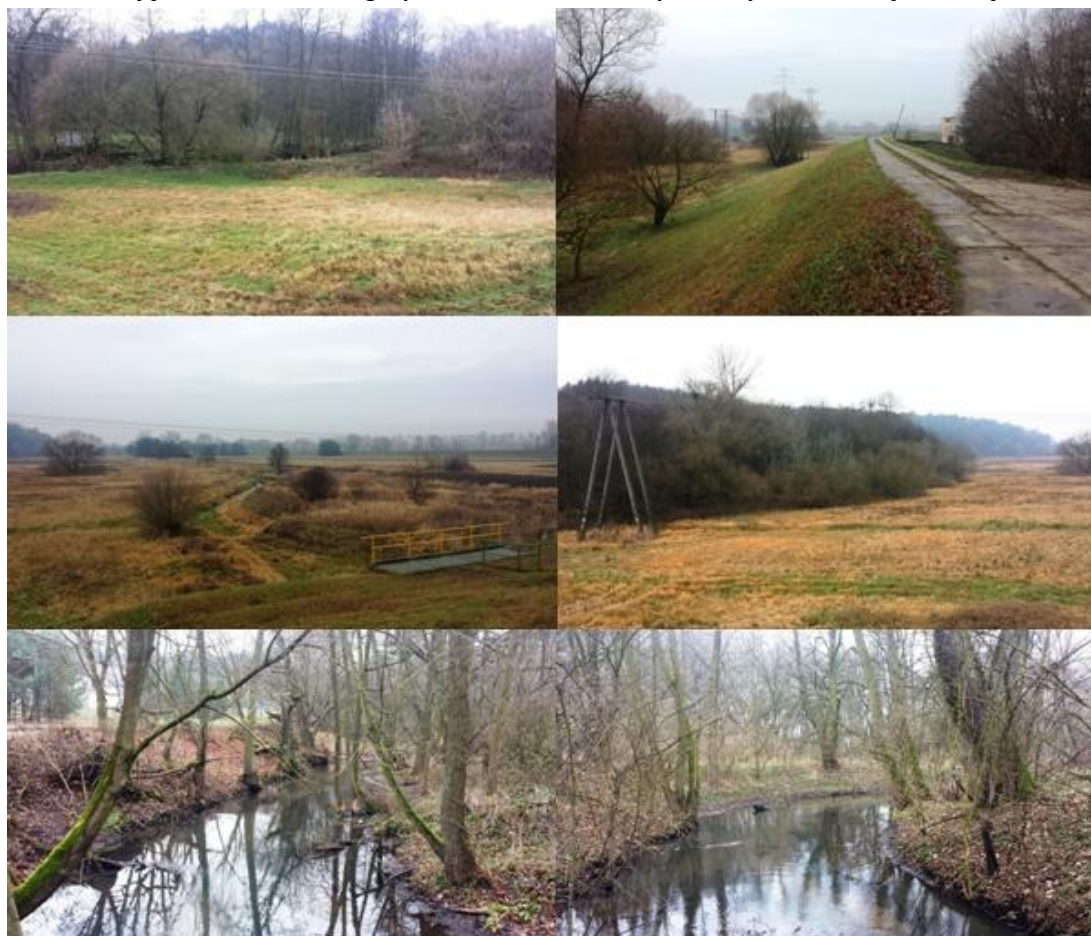
Zdjęcie 56. Aktualne zagospodarowanie terenów położonych nad rzeką Zielonką

Obszar objęty opracowaniem stanowi po części własność Lasów Państwowych, a częściowo Agencji Nieruchomości Rolnej. Teren ten nie jest objęty miejscowym planem zagospodarowania przestrzennego. Dolina rzeki Zielonki jest na chwilę obecną obszarem praktycznie niezagospodarowanym żadną infrastrukturą, za wyłączeniem zlokalizowanej w jej sąsiedztwie leśniczówki oraz reliktywów młynów.