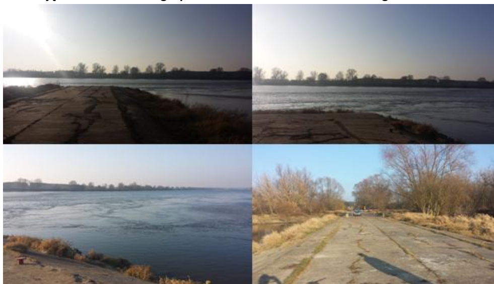
Zdjęcie 59. Aktualne zagospodarowanie obszaru nadwiślańskiego w Czarnowie

Na chwilę obecną teren ten jest praktycznie niezagospodarowany. Jedynym elementem infrastrukturalnym tego obszaru jest asfaltowa i betonowa droga dojazdowa (droga wojewódzka nr 249, a następnie droga gminna) oraz przyczółek związany z funkcjonowaniem w przeszłości w tym miejscu tymczasowego mostu dla wojska łączącego się ze zlokalizowanym na przeciwległym brzegu Wisły Solcem Kujawskim.