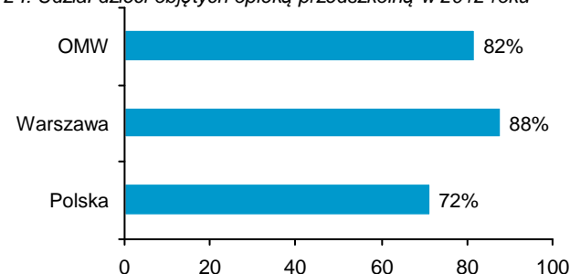
Wykres 24: Udział dzieci objętych opieką przedszkolną w 2012 roku