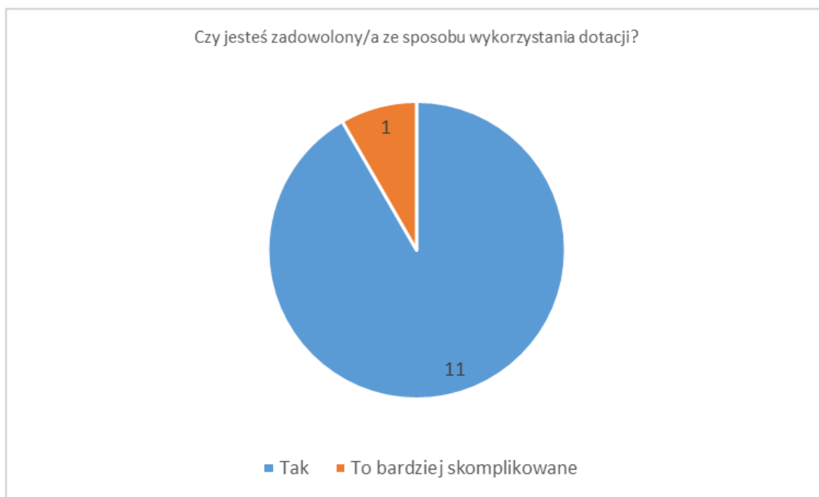
Rysunek 3. Czy jesteś zadowolony/a z tego w jaki sposób organizacja/e pozarządowa/e wykorzystają/ę otrzymaną/ę przez Ciebie darowiznę/ę?

Większość z osób, które interesowały się dalszym losem przekazanej darowizny było zadowolonych ze sposobu jej wykorzystania przez NGO.